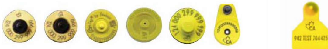
(Allflex FDX, Allflex HDX, Destron, Nedap, Reyflex, Y-Tex)

Le veau d'embouche est muni d'un des sept identifiants RFID canadiens approuvés